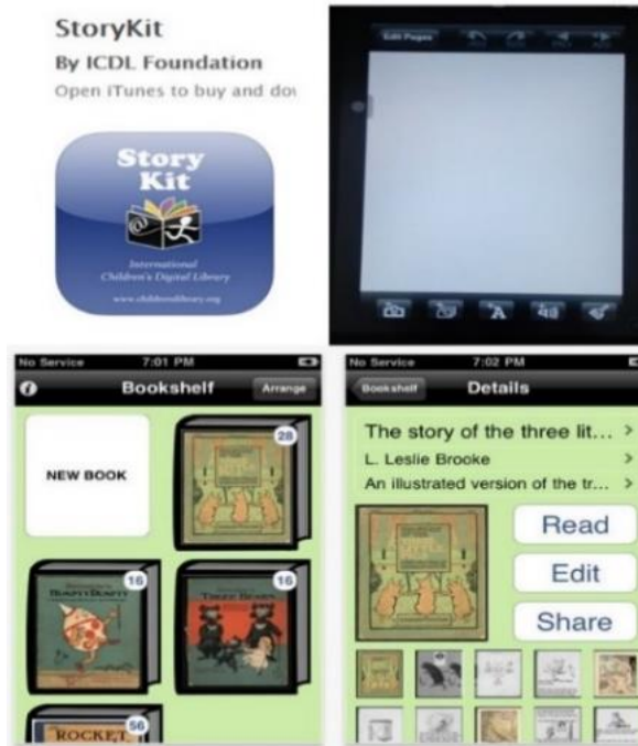
Rajah 3. Antara muka Storykit