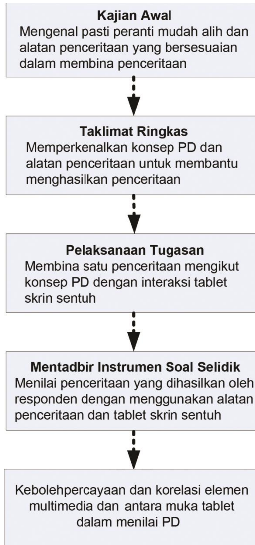
Rajah 1. Aktiviti pengumpulan data kajian