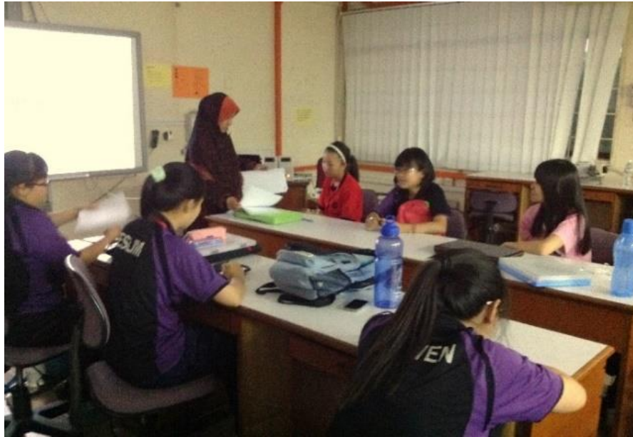
Rajah 4. Penyelidik memberikan taklimat ringkas kepada responden