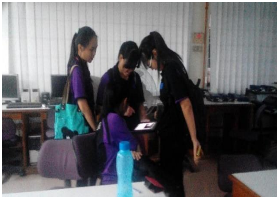
Rajah 5. Responden dibahagikan ikut kumpulan tugas dengan Storykit